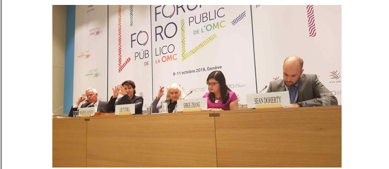
WTO Public Forum