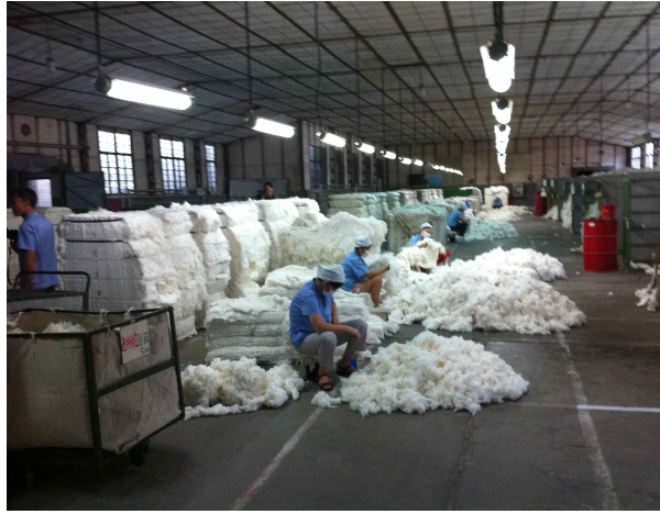
西安四棉紡織有限責任公司